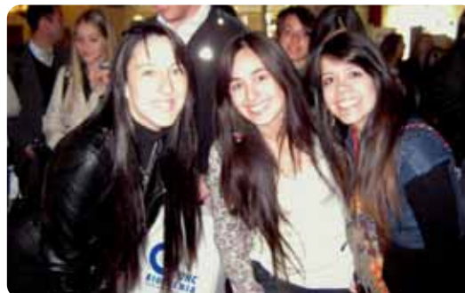
Estudiantes del Capítulo Estudiantil del 32º Encuentro de la Soc. de Cirugía BMF del C.O.C.