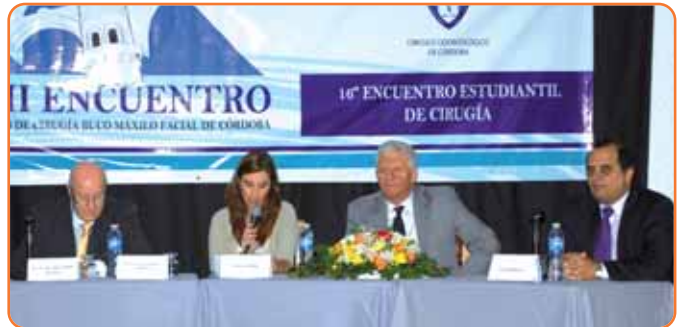
Foto: Mesa Redonda de Cirugía Ortognática.