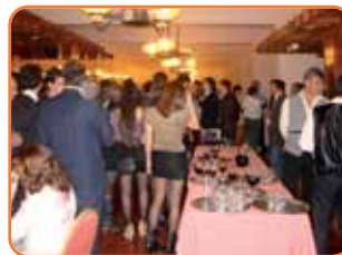
Foto izquierda: Cocktail de bienvenida.