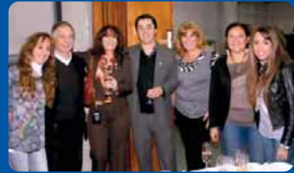
Autoridades del C.O.C. junto a la Decana de la F.O. - U.N.C.