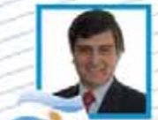
Dr. Pedro Gazzotti

ADÉMÁS: TEMAS LIBRES - EXPOSICIÓN DE POSTERS - MUESTRA COMERCIAL